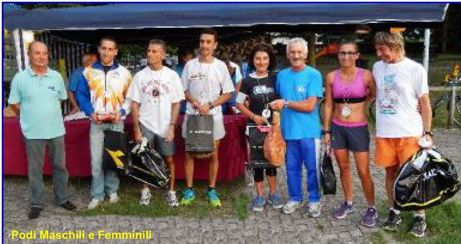
Podi Maschili e Femminili

La redazione: carlo-savini@alice.it - ferrino.fanti@fastwebnet.it - claudio.magnanelli@alice.it