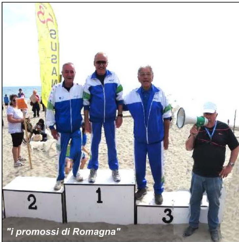
"i promossi di Romagna"