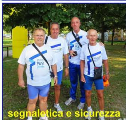
segnalatica e sicurezza