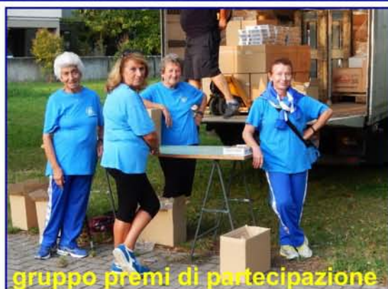
gruppo premi di partecipazione

Molto apprezzato il ristoro di Silvana con le leccornie messe a disposizione dal forno "Nonna Iride".