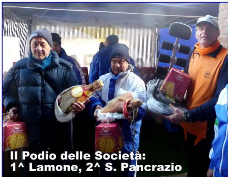
Il Podio delle Società: 1 a Lamone, 2 a S. Pancrazio