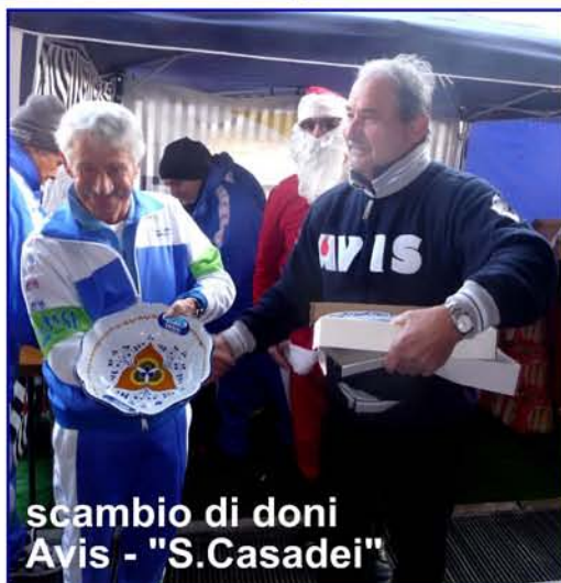
scambio di doni Avis - "S.Casadei"

3 a Avis Forlì, 4 a Caveya ADVS, 5 a Voltana, 6 a Mameli, 7 a I Podisti, 8 a Locomotiva, 9 a Alfonsinese, 10 a Cotignola, 11 a Drago, 12 a Tre Ponti, 13 a Cervese, 14 a Ponte Nuovo.