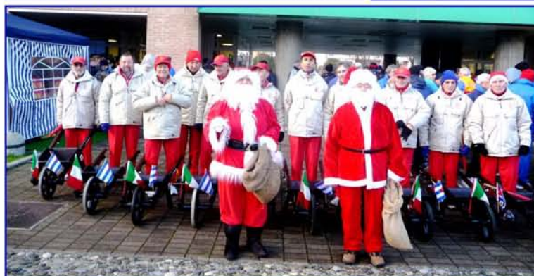
"Gli Scariolanti di Ravenna" alla 15 a apertura