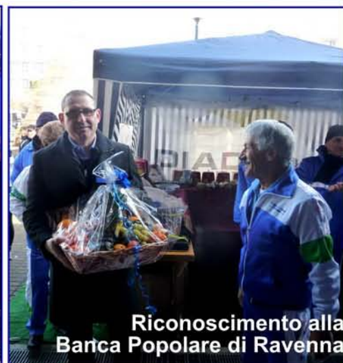
Riconoscimento alla Banca Popolare di Ravenna