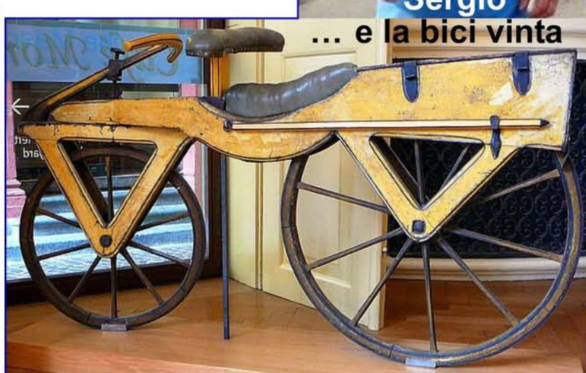
... e la bici vinta

Da qualche anno fanno parte del Comitato ravennate, anche L'Avis Forlì e bisogna dar merito al direttivo del Comitato che ha saputo superare barriere di contrapposizione che duravano da sempre, aprendo così alle Società ravennate la possibilità di partecipare a calendari della Provincia di Forlì/Cesena, vedi "Scarpaza"