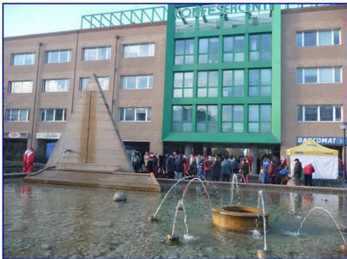
Un insieme del piassale di gara che ha ospitato 1.352 presenze in rappresentanza di 42 Società