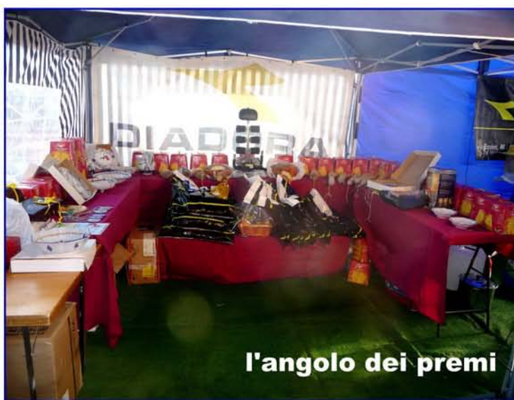
l'angolo dei premi

3 a Avis Forlì, 4 a Caveya ADVS, 5 a Voltana, 6 a Mameli, 7 a I Podisti, 8 a Locomotiva, 9 a Alfonsinese, 10 a Cotignola, 11 a Drago, 12 a Tre Ponti, 13 a Cervese, 14 a Ponte Nuovo.