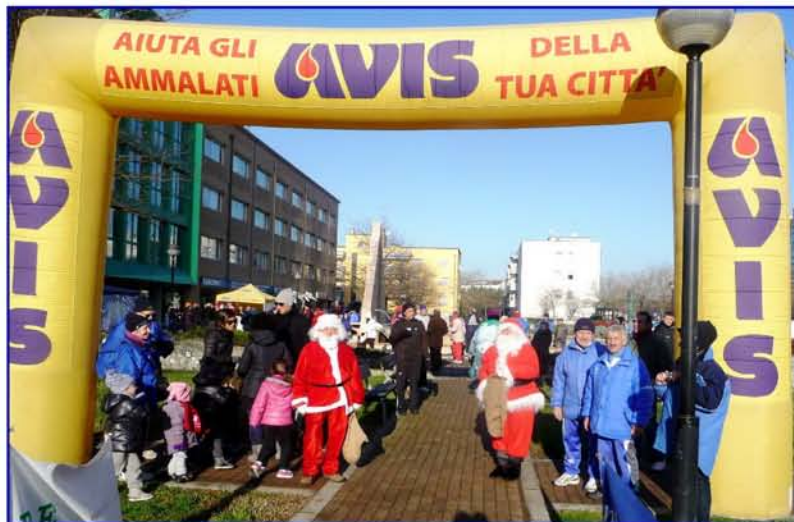
La bella immagine dell'arco d'arrivo della gara svolta in collaborazione con AVIS.