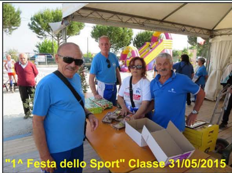
"1^ Festa dello Sport" Classe 31/05/2015