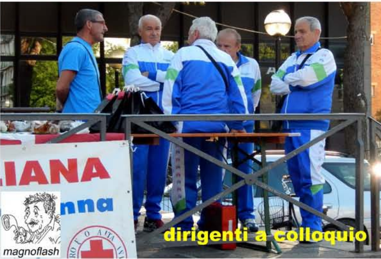
dirigenti a colloquio