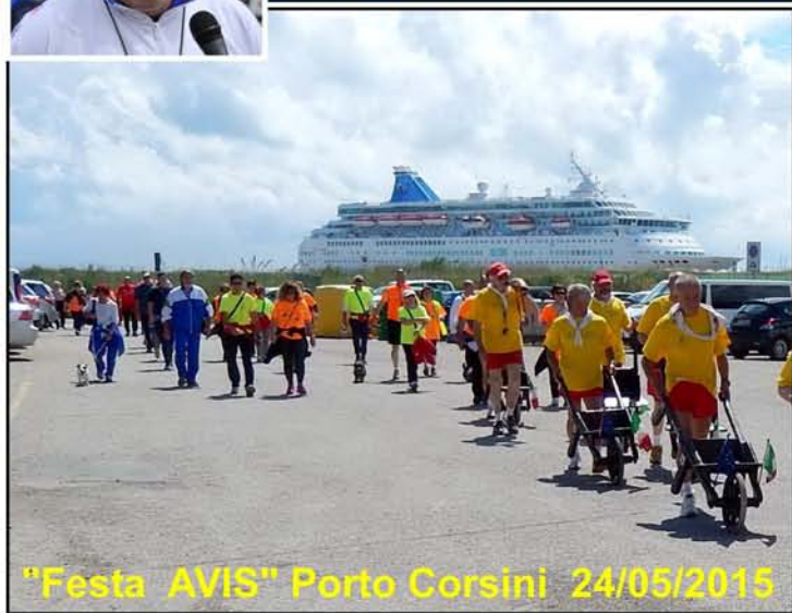
"Festa AVIS" Porto Corsini 24/05/2015