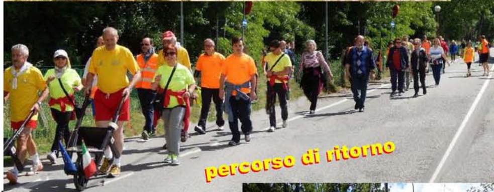
percorso di ritorno