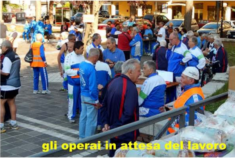
gli operai in attesa del lavoro