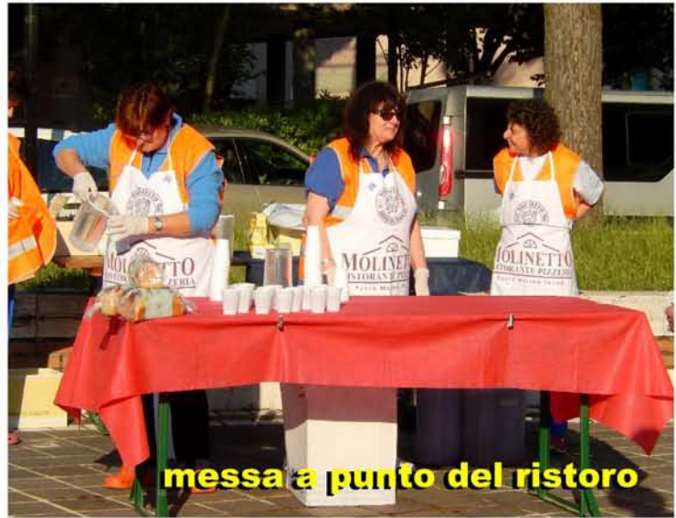
messa a punto del ristoro