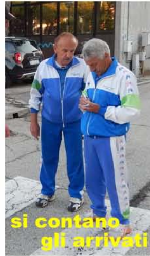
si contano gli arrivati