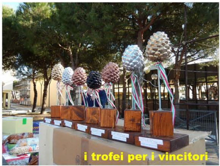
i trofei per i vincitori