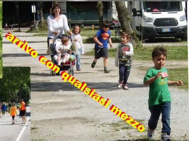
arrivo con qualsiasi mezzo