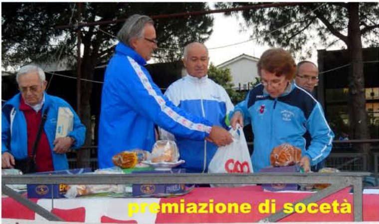
premiazione di società