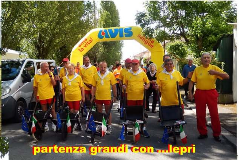
partenza grandi con ...lepri