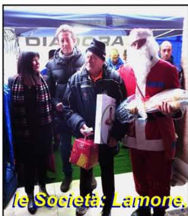
le Società: Lamone,