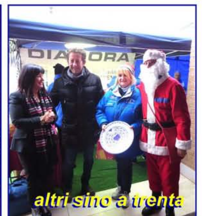
altri sino a trenta