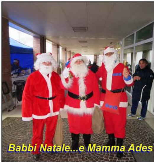
Babbi Natale...e Mamma Ades