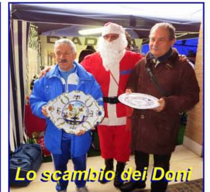
Lo scambio dei Doni